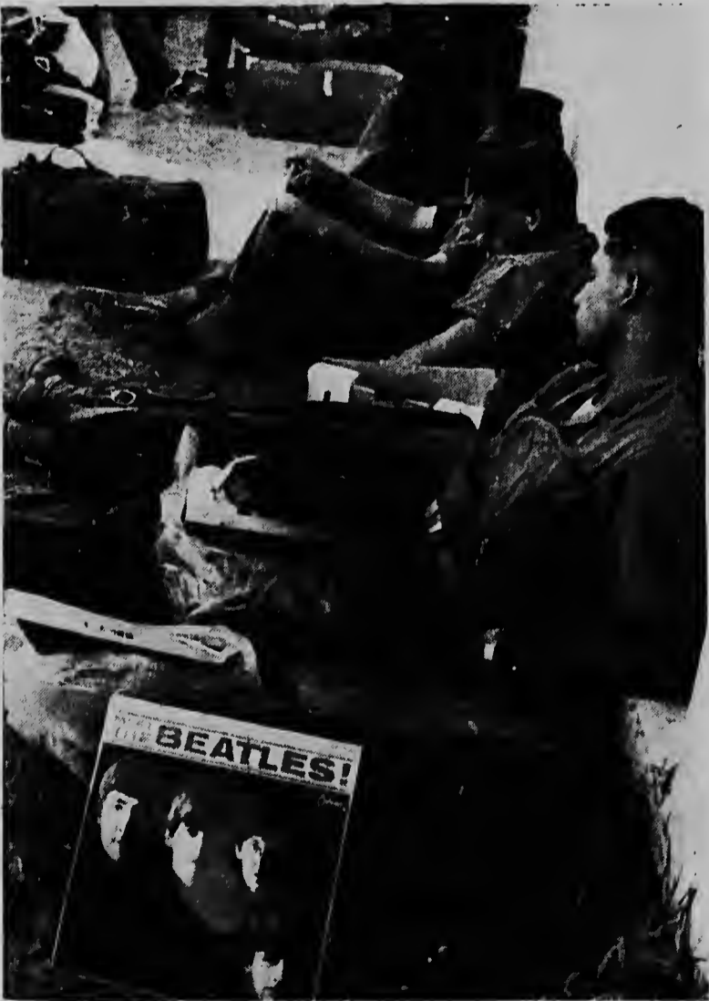
DA NANG, Sur Viet Nam - Un solda norteamericano, aki ta scuchando un disco di Beatles den e terminal militar na Da Nang, mientras nan tabata sosegando promer qu nan a regresa pa nan puesto di batalla na Le My.

E otro motibo tabata cu e camara di comercio di Paraguay tabata studiando seriamente e proposicion alertantiva, pa huntu cu interesadonan Arubano jega na establece un empresa nobo cu fin pa cuminsa un servicio di ferry entre Las Piedras (Paraguay) y Aruba. Esaki tabata loke "La Mañana" a publica.